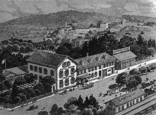
Die Krone im Jahr 1910

Am Samstag, 7. März 2010, findet die Generalversammlung der Clientis Sparkasse Oftringen statt, bei welcher wir für das Catering verantwortlich sind. Die Krone bleibt an diesem Tag geschlossen.